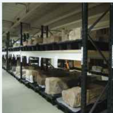
■ regali za muzeje - veća nosivost za teže eksponate