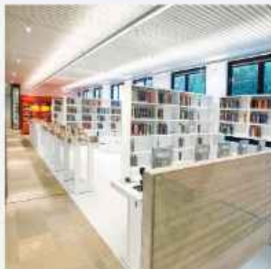
■ regali za biblioteke