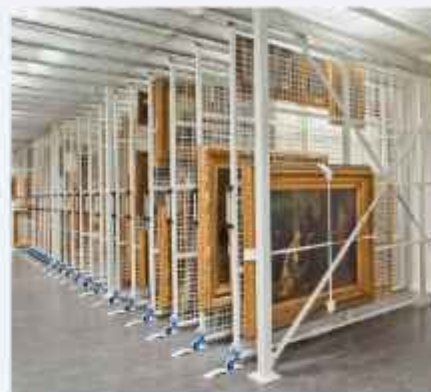
■ regali za muzeje - pokretne mreže za čuvanje slika