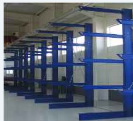
■ konzolni regali za skladišta