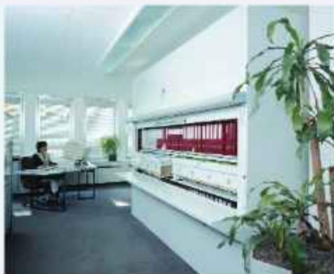
■ automatski kartotečni ormani - vertikalno čuvanje kartoteka, materijala