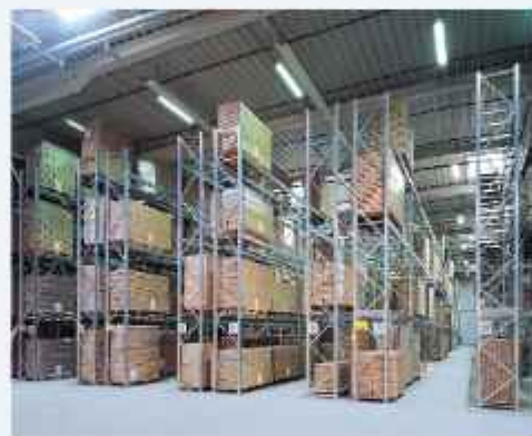
■ paletni regali za skladišta